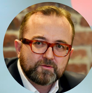
Christophe ITIER Haut Commissaire à l'ESS et à l'innovation sociale