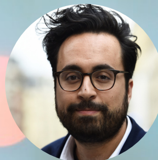
Mounir MAHJOUBI Secrétaire d'État au numérique

Située en plein air, la scène principale accueillera dès le vendredi après-midi conférences, tables rondes, discours institutionnels et « RedX » des penseurs et acteurs de notre monde en transformation !